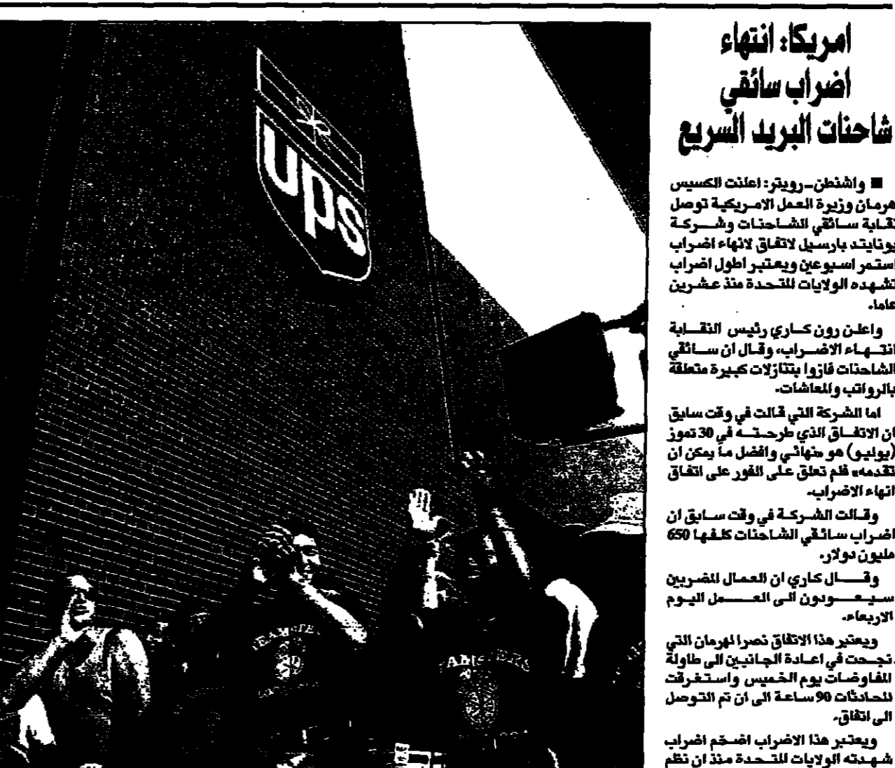
مستخدمون في شركة بريد اس إس يصطفون أمام مبنى الشركة لإلقاء نفاياتهم

البيروقراطية وال... (Text continues in the left margin)